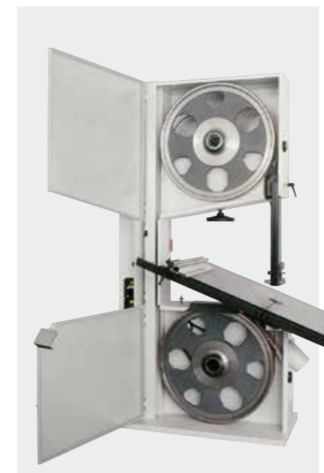
Aura 800 Aura 800