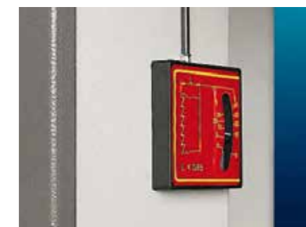
Indicatore di tensione lama (solo versione C.E.) Indice tension hoja (solo para configuracion C.E.)