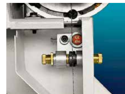
Guidalama inferiore (opzionale) Guíahoja inferior (opcion)