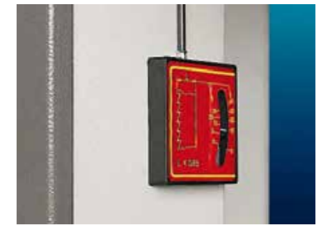
Blade tension indicator (only for C.E. version) Blattspannungsanzeige (nur für C.E. Ausführung)