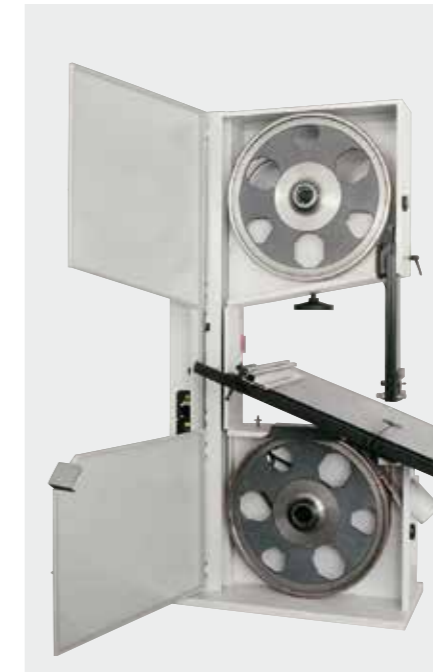
Aura 800 Aura 800