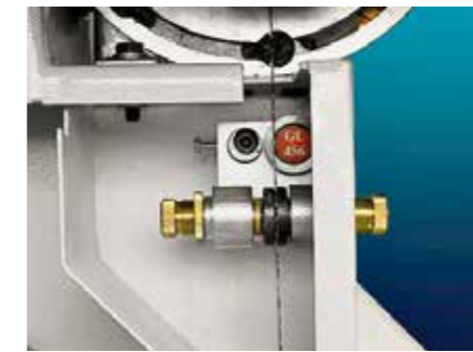
Adjustable lower blade guide - on request Untere Rollenführung - auf Anfrage