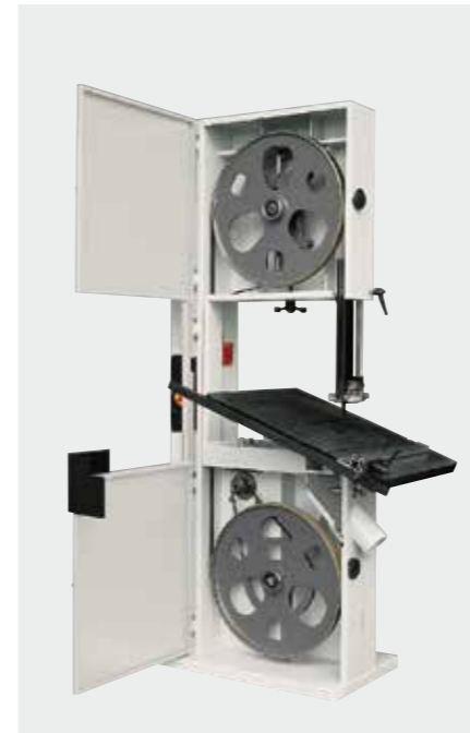
Aura 560 Aura 560